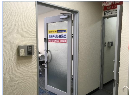
④手前にガラスの扉があります。 こちらが会場です。