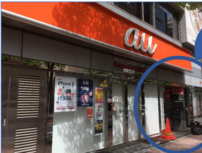
①1階にauがあるビルの4階です。