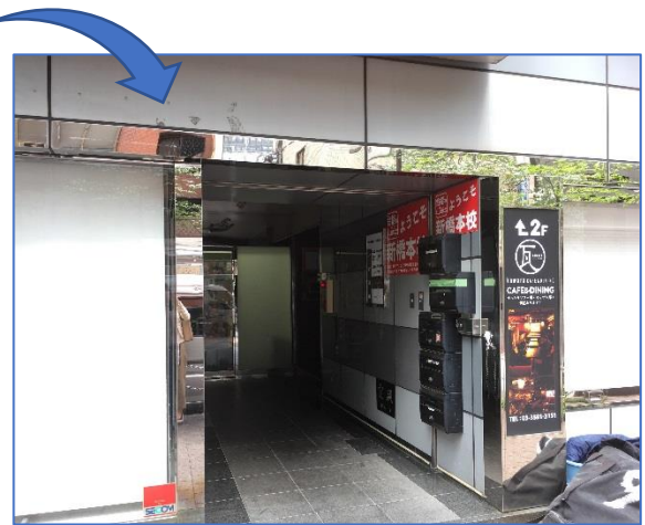
②auを正面に右手が入り口です。