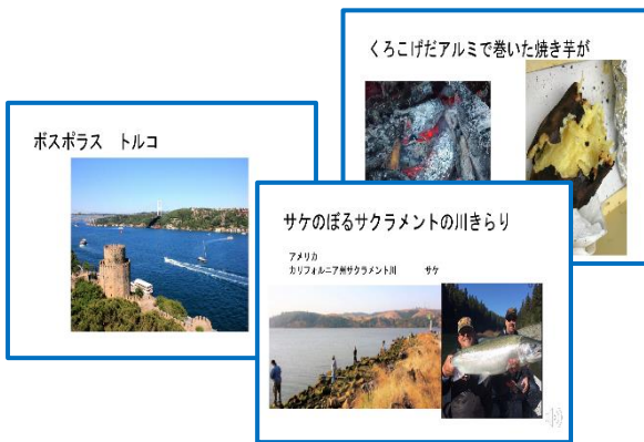
俳句のクラスで実際に使用しているスライド

子どもたちは雪など北米にも憧れがありますし、ラクダ、マンゴーなどパキスタンでも馴染みの深い情景がある西アジア・中東の子供の作った俳句が好きということが多くですね。リズムや五七五に慣れ親しむだけで十分だと考えて、普段のクラスの中ではあえて俳句を作ることを強制させていません。そのうち、作りたくなる！という気持ちが出てきたときは、自由に発言させています。