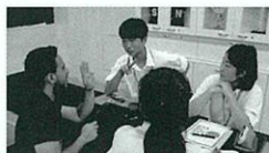
ハーバード・サマースクール