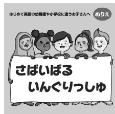
「ぬりえ」 (130×130mm) 表紙