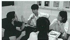
ハーバード・サマースクール